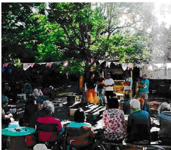
Le Gapeau en transition lors de son assemblée générale annuelle.

Et de rappeler ce qu'est le pacte de transition écologique sur lequel le maire est interrogé, dans l'entretien, mais aussi le contexte dans lequel le candidat et futur édile l'a signé. À sa-